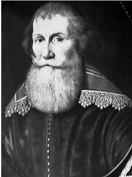
Eerste ambassadeur van de Republiek der Zeven Verenigde Nederlanden. Zijn voornaamste benoeming was aan het Osmaanse Rijk in 1612 tot 1639

zou daardoor niet als belangrijk genoeg gezien worden om de gehele internationale betrekkingen ervoor op het spel te zetten.