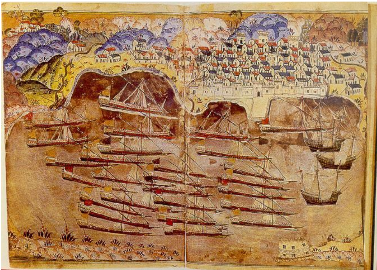
De overwintering van de Osmaanse vloot in de Franse havenstad Toulon onder leiding van Barbaros Hayrettin Paşa. Gemaakt door Matrakçı Nasuh in 1543

Hayrettin veroverde Gibraltar in 1540 en sloot de ingang tot de Middellandse Zee vanaf de Atlantische Zee. Het puntje van Spanje was strategisch gezien zeer belangrijk en de Habsburgers probeerden uit alle macht het te heroveren. De tegenaanval uit 1541 onder leiding van Karel V mislukte echter jammerlijk. Ook de poging om de bevoorradinglijnen vanuit Algiers te blokkeren werd afgeslagen. Hierop consolideerde Hayrettin zijn macht en breidde deze zelfs uit. Het puntje van de Italiaanse laars, de belangrijke havenstad Reggio di Calabriadië, viel in 1543 in Osmaanse handen. Hayrettin ging door en nam kort daarna ook de macht over in Messina, de voornaamste havenstad van Sicilië. In Rome ontstond grote paniek toen deze twee havens en de omliggende gebieden geplunderd werden door Hayrettin. De Fransen probeerden te interveniëren, maar verloren hierbij de zuidelijke havens Marseille, Nice en Toulon aan Hayrettin. In 1544 overwinterde Hayrettin Paşa met een groot deel van zijn vloot in Frankrijk; Nice en Toulon werden maandenlang overheerst door Barbarijse en Turkse Osmanen. Doorhebbend dat het met bruto geweld niet mogelijk was de Osmaanse Hayrettin te verslaan, werd er besloten om hem af te kopen. Hayrettin verliet, met zijn vloot, de Franse havens voor een fikse geldprijs.