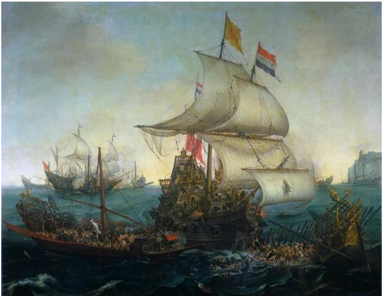
Noord-Nederlandse schepen rammen Spaanse galeien voor de Vlaamse kust in oktober 1602. Gemaakt door Hendrick Corneliszoon Vroom in 1617.

doorhebbend, ook naar de Atlantische Zee getrokken zijn om zich uiteindelijk aan te sluiten bij de al aanwezige Osmaans-Barbarijse zeelieden in Nederland. De gevangen galeislaven die vrijkwamen na interventie van de Watergeuzen, zouden na het zien van de talrijke Osmaans-Turkse symbolen in de Nederlanden toch sneller geneigd zijn om zich bij hun bevrijders te voegen voor een periode. De aanwezigheid van andere Osmaanse soldaten op bevel van de sultan, gevoelens van dankbaarheid en een drang om wraak te nemen op de Spanjaarden, die hun maandenlang gevangen hielden, waren andere factoren die ongetwijfeld hebben bijgedragen aan het besluit om in de Nederlanden te blijven en de Watergeuzen bij te staan in hun strijd tegen de Spaanse Habsburgers. Vooral de grootschalige aanwezigheid van Turks-Osmaanse vlaggen op de Nederlandse Watergeuzen zou een immens grote invloed gehad hebben op de moraal van de Osmaans-Barbarijse bevrijde galeislaven.