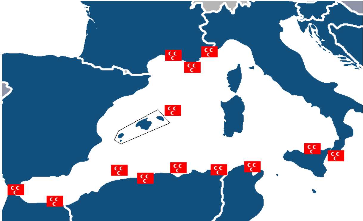
Osmaanse havens en uitvalsbases in de Middellandse Zee ten tijde van admiraal Hayrettin

Het vooruitzicht op een Middellandse Zee dat volledig onder controle zou zijn van het Osmaanse Rijk en, net als de Egeïsche Zee, een Osmaanse binnenlandse zee zou worden, nam serieuze gestalten aan na 1538. Een immens grote vloot met schepen van alle katholieke staten waarmee de Osmanen in staat van oorlog waren voer onder leiding van de Habsburgse vorst Karel V naar Hayrettin Paşa. De Pauselijk-Venetiaans-Habsburgse vloot vond de confrontatie die het zocht, maar werd in 1538 verslagen door Hayrettin en verloor daarbij een groot deel van de schepen. Hierdoor ontstond er een vacuüm in de zeemachten van de katholieke grootmachten. Hayrettin nam er gretig gebruik van en veroverde achtereenvolgens havens in Spanje, Italië, Frankrijk en Venetië.