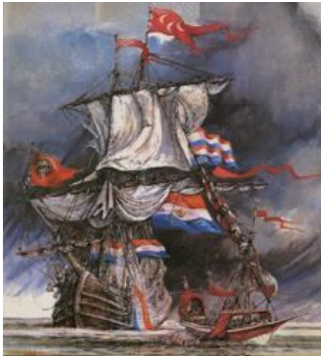
Een Nederlands schip uit de Gouden Eeuw, waar aan de mast duidelijk de rode Turks-Osmaanse vlag (met drie halve manen) te zien is. 48

groepen Osmaanse strijders en zeelieden aanwezig staan, staat buiten kijf. 46 Inmiddels gepensioneerd hoogleraar Turkologie aan de Universiteit van Leiden Alexander de Groot, verhaalt over een tweede mogelijkheid. 47 De constante aanvallen van de Watergeuzen op de Spaanse vloot, zou een stroom aan galeislaven hebben bevrijd. Deze galeislaven, die uit de Middellandse Zee afkomstig waren en noodgedwongen te werk gesteld werden op Spaanse schepen in de Atlantische Oceaan, zouden van Osmaans-Barbarijse afkomst zijn geweest. Een ruime 1500 bevrijde galeislaven zouden zich uit dankbaarheid (en de mogelijkheid om wraak te kunnen nemen op de Spanjaarden) bij de Watergeuzen hebben gevoegd. Na afloop van de Slag bij Zeeland (1599-1604) zouden deze Osmaanse zeelieden in Algerije, toen nog onderdeel van het Osmaanse Rijk, afgezet worden. Het feit dat de Watergeuzen vele Osmaans-Turks symbolen en vlaggen gebruikten, maakte de keus uiteraard makkelijker voor de zeelieden. Uiteraard is de kans dat beide opties mogelijk zijn, ook zeer aanwezig. Dat wil zeggen een groep van enkele honderden Osmaanse soldaten met wapens, vlaggen en kledij aan boord van drie schepen die door de Osmaanse sultan gestuurd waren en gaandeweg meer bevrijde Osmaanse strijders aantrokken.