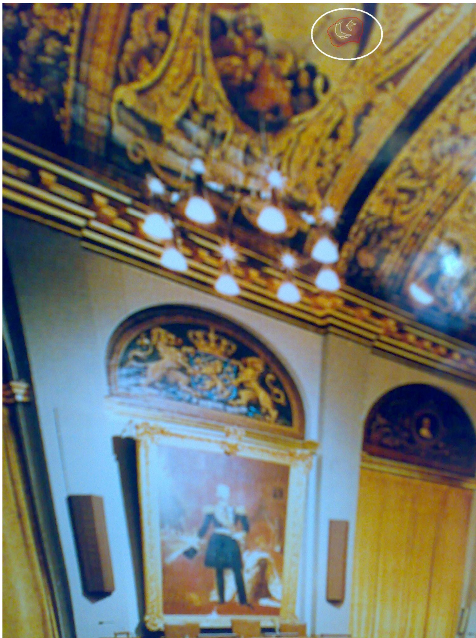
Vergaderzaal van de Staten-Generaal met de Osmaans-Turkse vlag